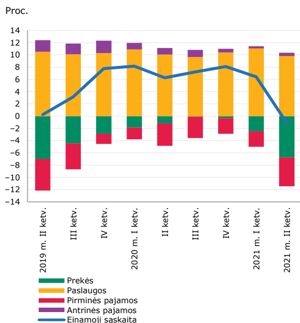
1 pav. ESB ir jį sudarantys srautai, palyginti su BVP

Lietuvos bendroji skola užsieniui antrojo ketvirčio pabaigoje buvo 38,7 mlrd. Eur, arba 75,7 proc. BVP, o grynoji skola užsieniui buvo neigiama ir sudarė 1,1 mlrd. Eur, arba 2,2 proc. BVP.