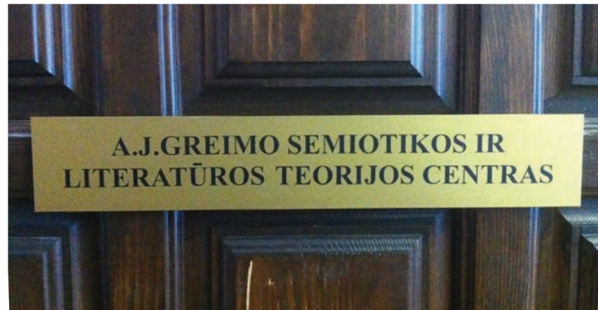
Vilniaus universitete veikiantis A. J. Greimo semiotikos ir literatūros teorijos centras, įkurtas 1992 m.