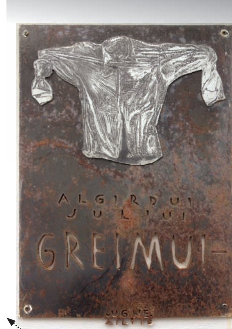
Ugnės Žilytės miniatiūra – atminimo lenta Vilniuje, Literatų g. (Literatų gatvės meno projektas)