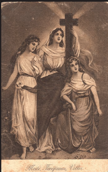
Atvirukas „Meilė, Tikėjimas, Viltis“. Kaunas, 1921 m.

Tačiau kur toji atsvara, padedanti atsilaikyti, kai, atrodo, tamsos šešėliai tokie tiršti, jog sunku įžiūrėti net mylimo žmogaus veidą? Kas suteikė atsparumo jūreiviams, pasiklydusiems vandenyno viduryje, ar atradėjams, atkakliai, nežmoniškoms sąlygomis traukusiems šiaurės link? Kas padarė įmanomą laukimą jų namuose likusiems artimiesiems? Viltis, nuolankiausia iš trijų dieviškųjų dorybių, anot popiežiaus Pranciškaus. Nuolankiausia, nes paslėpta. Tačiau viltis – tai ne iliuzija, tai – dorybė, kuri niekada nenuvilia, kai ją augini. Viltis – vienas svarbiausių krikščioniškosios civilizacijos aspektų, dovana, padedanti išlikti tuomet, kai, atrodo, tam nėra jokių galimybių. Krikščioniškojoje ikonografijoje vilties simbolis – inkaras, suteikiantis pastovumą, saugų uostą ir ramybę