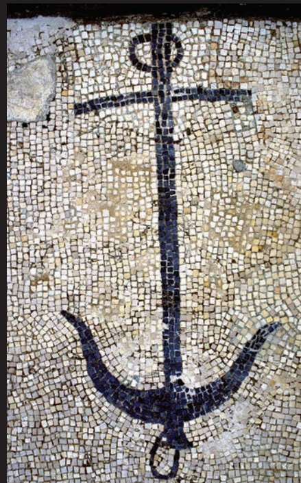
Inkaras iš romėnų namų Delos saloje.

Tamsiausia naktis būna prieš aušrą? Nuo amžių pradžios žmonija turi pakankamai priežasčių kentėti: potvyniai ir sausros, ugnikalnių išsiveržimai, uraganai ir taifūnai, skėriai ir žemės drebėjimai. Ką jau ir kalbėti apie tą blogį, kurį vienas žmogus gali sąmoningai padaryti kitam. Istorikai įmanomoje apžvelgti žmonijos praeityje būta maždaug 14 400 karų, per kuriuos žuvo (spėjama) apytiksliai 3,5 milijardo žmonių, taigi beveik kas tryliktas pasaulio gyventojas.