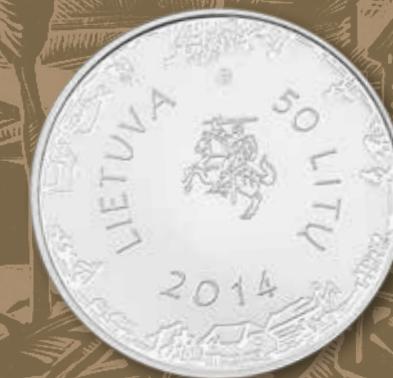
50 LITŲ MONETA, SKIRTA KRISTIJONO DONELAIČIO 300-OSIOMS GIMIMO METINĖMS