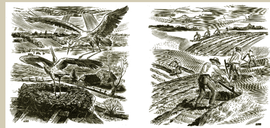
Grafiko Vytauto Kazimiero Jonyno (1907–1997) medžio raižiniai. Ilustracijos iš leidinio „Metai“. Kristijonas Donelaitis. Metai . Kaunas: Valstybinė leidykla, 1941.

Donelaitis skelbė amžinojo sugrįžimo bei ciklinio judėjimo idėją. Jo saulele meiliai vadinama Saulė pavasariop grįžta ir kopja į zenitą, o rudenį ritasi tolyn, visą laiką diktuoama