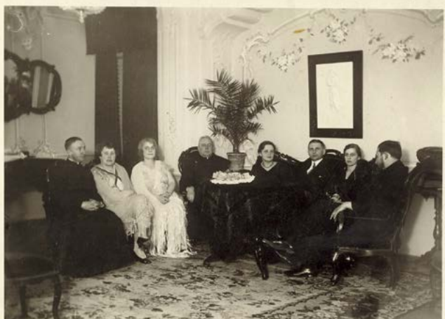
Maironis su svečiais savo namuose apie 1930 m.

Paskutinį gyvenimo dešimtmetį Maironis daug dirbo kaip literatūros mokslininkas, parašė vadovėlį „Visuotinės literatūros istorija“ (1926), Kauno kunigų seminarijoje