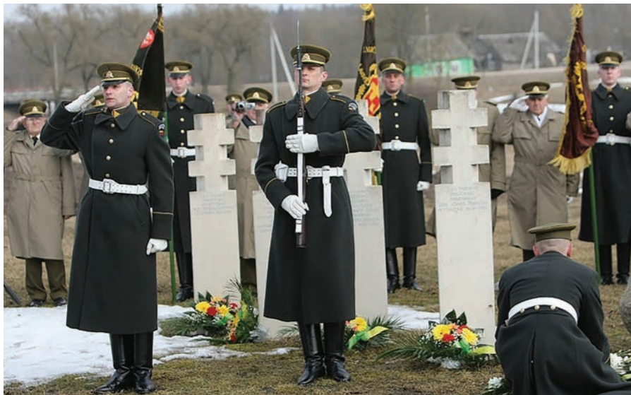
Miknių Petrėčių memorialas, skirtas aštuoniems Lietuvos partizanų apygardų vadams atminti. Laisvės Kovos Sąjūdžio Tarybos deklaracijos 67-ųjų metų minėjimas Minaičiuose.

viršininkas. 1948 m. paskirtas Prisikėlimo apygardos vadu, o 1949 m. – LLKS Tarybos Prezidiumo pirmininko trečiuoju pavaduotoju. Žuvo 1950 m. liepos 22 d. Ariogalos rajone Daugėliškių miške.