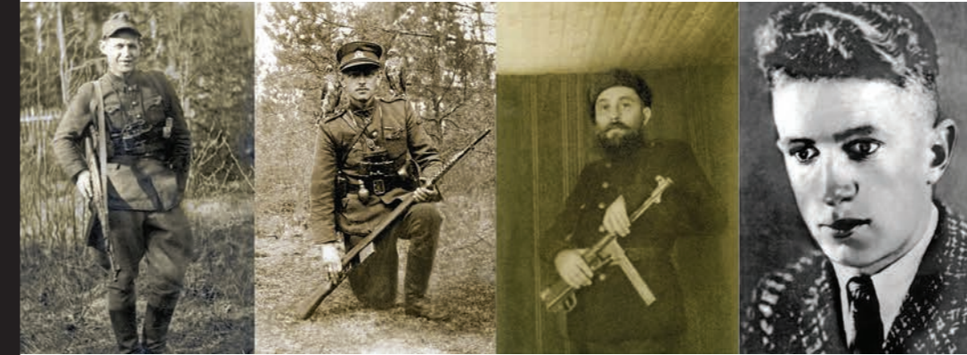
Jonas Žemaitis-Vytautas (1909–1954) Adolfas Ramanauskas-Vanagas (1918–1957) Juozas Šibaila-Merainis (1905–1953) Petras Bartkus-Žadgaila (1925–1949)

svarbiausius sprendimus. Pasitarimuose apsvarstyti įvairūs su partizanų kova susiję klausimai: statusas, organizacijos ideologija, veiklos taktika ir kt. 1949 m. vasario 16 d. aštuoni partizanų atstovai pasirašė LLKS Tarybos deklaraciją, numatančią, kad LLKS Taryba yra „aukščiausias tautos politinis organas, vadovaująs politinei ir karinei tautos išlaisvinimo kovai“. Šiame dokumente numatytos ir Lietuvos ateities gairės – demokratinė respublika, socialiai orientuota valstybė. Per susitikimą suformuota aukščiausioji LLKS vadovybė. Po posėdžio išsiskirstė partizanų atstovai