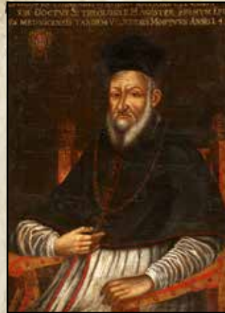
▲ Pirmasis žemaičių vyskupas (1417–1422 m.) Motiejus. Nežinomas dailininkas, XVII a. Lietuvos dailės muziejus

Akcija baigėsi 1417 m. spalio 23–24 d. Trakuose, kur buvo išrinktas ir įšventintas Medininkų vyskupas. Lvovo ir Vilniaus vyskupai Susirinkimui surašė ataskaitą apie nuveiktus darbus: pakrikštyta „daug tūkstančių žmonių ir vaikų“, įkurta „daug parapijų bažnyčių“, kuriose palikta daug išbandytų vyrų, kad krikštytų dar nepakrikštytuosius. Į šias žinias sureagavo ir Zigmantas Liuksemburgietis, ir naujasis popiežius Martynas V – pastarasis 1417 m. gruodžio laiške Jogailai sakosi sužinojęs, kad „beveik visi“ žemaičiai prisijungę prie Katalikų Bažnyčios. Popiežius 1417 m. gruodžio laiške pranešė iš Lvovo arkivyskupo ir Vilniaus vyskupo girdėjęs apie žemaičių „konversiją ir krikštą“. 1417 m. spalio 24 d. buvo įkurta Medininkų vyskupija ir pirmosios parapijos Ariogaloje, Raseiniuose, Medininkuose, Kražiuose, Viduklėje, Veliuonoje, Kaltinėnuose, galbūt Betygaloje ir Luokėje.