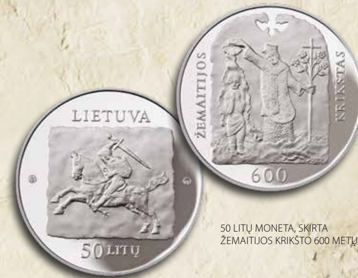
50 LITŲ MONETA, SKIRTA ŽEMAITIJOS KRIKŠTO 600 METŲ SUKAKČIAI

Išleido Lietuvos bankas, Gedimino pr. 6, LT-01103 Vilnius Spausdino UAB „LODVILA“, www.lodvila.lt, LT-08125 Vilnius