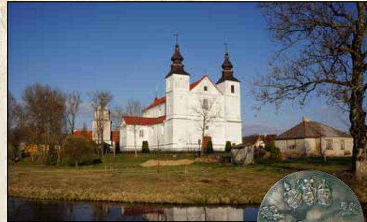
▲ Varnių katedra, Žemaičių vyskupijos pagrindinė šventovė 1417–1864 m.