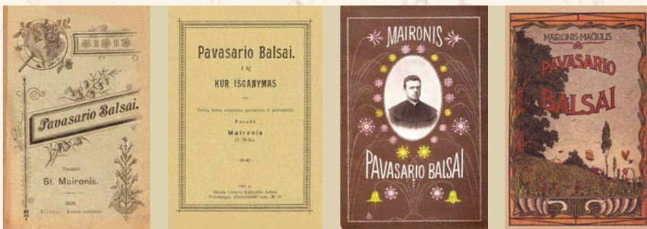
„Pavasario balsų“ leidimų (1895, 1905, 1913, 1920) viršeliai

dėstė Lietuvos istoriją, pasaulinę literatūrą, moralinę teologiją, pastarąjį dalyką ir lietuvių literatūros istoriją dėstė ir Lietuvos universitete, kurį įkuriant pats aktyviai dalyvavo.