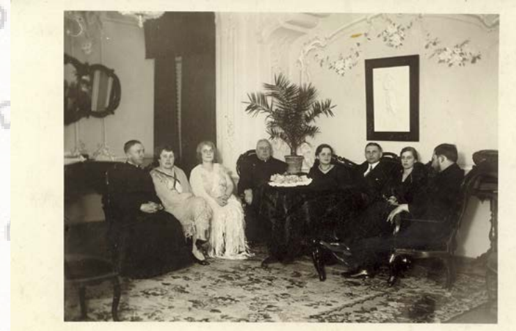
Maironis su svečiais savo namuose apie 1930 m.

Svarbi Maironio poetinės kūrybos dalis yra poemos, jose autorius išreiškia savo visuomeninę, istorinę, moralinę poziciją. Parašė kelis šio žanro kūrinius: „Tarp skausmų į garbę“ (vėliau jį pertaisė ir pavadino „Jaunoji Lietuva“), „Raseinių Magdė“, „Mūsų vargai“, lenkų kalba „Z nad Biruty“ („Nuo Birutės kalno“). Ilgai, su petraukomis rašė poemą „Mūsų vargai“: ją pradėjo kurti 1911 m., o