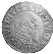
8 pav. Prūsija. Albrechtas I. Grašis. 1544 m. Ø 23,7 mm, P – 2,01 g (Vilnius, Trakų g. 9, GRD 63760)