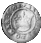
4 pav. Lenkija. Žygimantas Senasis. Pusgrašis. 1508 m. Ø 18,6 mm, P – 0,83 g (Vilnius, Trakų g. 9, GRD 63755)