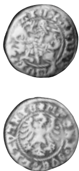
2 pav. LDK. Aleksandras. Pusgrašis. (1503–1506 m.) Ø 19,7 mm, P – 1,32 g (Matielių lobis, Molėtų r., NL 38–2)

Kaip rodo Lietuvoje rastų lobių medžiaga (juose beveik visada aptinkami tik pusgrašiai), tarp šio laikotarpio monetų daugiausia apyvartoje buvo Aleksandro LDK pusgrašių. Lenkiški Aleksandro pusgrašiai sudaro apie 15 procentų to paties valdovo LDK pusgrašių, tiek pat yra ir Jono Albrechto pusgrašių [9, p. 32, 34, 40, 45, 47–48, 52–53, 65]. Tokį didelį LDK pusgrašių kiekį galima būtų paaiškinti tuo, kad vietinė rinka dar buvo uždara svetimoms monetoms ir jos poreikius tenkino kaldinamos vietinės monetos. Palyginę Aleksandro LDK pusgrašių kiekį lobiuose su Žygimanto Senojo LDK pusgrašių kiekiu, pamatysime, kad Aleksandro pusgrašiai vidutiniškai sudaro 38,77 procento Žygimanto Senojo monetų. Žygimanto Senojo pusgrašių emisija sudarė apie 25–30 mln. vnt. (žr. toliau), tad Aleksandro pusgrašių, remiantis lobių sudėtimi, galėjo būti nukaldinta apie 9,7–11,6 mln. vnt. Tačiau radinių duomenys, kai lyginamos vieno valdovo monetos su kito valdovo monetomis, ne visada yra patikimi (pvz., Žygimanto Senojo, palyginti su Žygimanto Augusto, pusgrašių kiekis radiniuose mažesnis 1,6 karto (žr. toliau)). Ankstesnio valdovo monetų apyvartoje visada būna mažiau negu esamo. Tad ir Aleksandro pusgrašių galėjo būti nukaldinta daugiau – apie 15–20 mln. vnt.