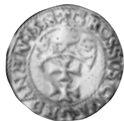
6 pav. Gdanskas. Žygimantas Senasis. Grašis. 1538 m. Ø 22,4 mm, P – 1,80 g (Matelių lobis, Molėtų r., NL 38–473)