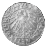
14 pav. Legnica–Brigas. Frydrichas II. Grašis. 1544 m. Ø 22,5 mm, P – 1,73 g (Pagiegalos senkapis, Panevėžio r., AR 51:15)