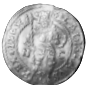
24 pav. Vengrija. Ferdinandas I. Dukatas. 1564 m. Ø 22,4 mm, P – 3,55 g (Vilnius, Valdovų rūmai, GRD 91010)