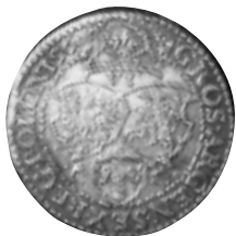
20 pav. Lenkija. Zigmantas III Vaza. Šeštokas. 1596 m. Marienburgas. Ø 27,7 mm, P – 4,63 g (Matelių lobis, Molėtų r., NL 38–589)