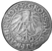
23 pav. Brandenburger-Krosna. Johanas. Grašis. 1545 m. Ø 22,8 mm, P – 1,73 g (Matelių lobis, Molėtų r., NL 38–632)