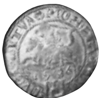
5 pav. LDK. Žygimantas Senasis. Grašis. 1536 m. Ø 26,0 mm, P – 2,42 g (N 16004)

palyginti su denarais, sudaro net 99,2 procento, o senkapiuose denarų kiekis – 94,7 procento. Tad šių abiejų nominalų emisijos kiekio santykį nustatyti yra labai sunku. Tačiau denarų emisijos dydį gali šiek tiek nusakyti kita to paties nominalo moneta, tai – Žygimanto Augusto denarai, kaldinti 1546–1560 m. ir 1563 m. Senkapiuose Aleksandro denarai sudaro 77,7 procento Žygimanto Augusto denarų kiekio (Aleksandro – 489 vnt., Žygimanto Augusto – 140 vnt.) [20, p. 147]. Jei prie Žygimanto Augusto denarų kiekio dar pridėsime ir to paties valdovo dvidenarius (158 vnt.) (artimas nominalas denarui), gausime, kad Aleksandro denarai senkapiuose sudaro 62,1 procento Žygimanto Augusto denarų ir dvidenarių kiekio. Žygimanto Augusto denarų galėjo būti nukaldinta apie 60 mln., o dvidenarių – daugiau kaip 10 mln. (žr. toliau). Tad Aleksandro denarų galėjo būti nukaldinta apie 45–50 mln. Tačiau, kaip matome, Žygimanto Augusto denarų ir dvidenarių radinių senkapiuose santykis priešingas jų nukaldintam kiekiui, be to, nežinome ir tikslaus nukaldintų dvidenarių kiekio, tad galimos paklaidos.