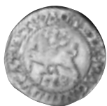
11 pav. LDK. Žygimantas Augustas. Pusgrasius. 1563 m. Ø 19,2 mm, P – 1,17 g (Vilnius, Dominikonų g. 4, N 20345)