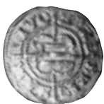
10 pav. Ryga. Hermanas fon Briugenėjus. Šilingas. 1540 m. Ø 19,5 mm, P – 0,92 g (Pagie- galos senkapis, Panevėžio r., AR 51:10)