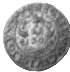
19 pav. Ryga. Zigmantas III Vaza. Šilingas. 1593 m. Ø 18,6 mm, P – 1,22 g (Ruseinių senkapis, Kėdainių r., AR 508:71)