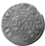
15 pav. LDK. Steponas Batoras. Šilingas. 1584 m. Ø 18,9 mm, P–0,91 g (Materiųjų lobis, Molėtų r., NL 38–253)