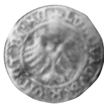
9 pav. Svidnica. Liudvikas II. Pusgrašis. 1520 m. Ø 18,7 mm, P – 0,89 g (Matelių lobis, Molėtų r., NL 38–452)