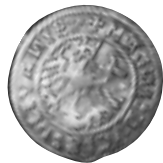
3 pav. LDK. Žygimantas Senasis. Pusgrašis. 1520 m. Ø 20,6 mm, P – 1,14 g (Matielių lobis, Molėtų r., NL 38–96)