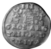
16 pav. LDK. Steponas Batoras. Trečiokas. 1584 m. Ø 21,9 mm, P – 2,37 g (Senasialio lobis, Vilniaus r., NL 5–24)