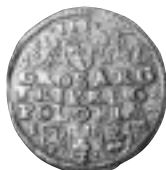
18 pav. Lenkija. Zigmantas III Vaza. Trečiokas. 1596 m. Poznanė. Ø 21,3 mm, P – 2,44 g (Senasialio lobis, Vilniaus r., NL 5–65)