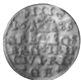
17 pav. Ryga. Steponas Batoras. Trečiokas. 1586 m. Ø 20,2 mm, P – 2,42 g (Senasialio lobis, Vilniaus r., NL 5–35)