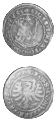
7 pav. Prūsija. Žygimantas Senasis. Grašis. 1529 m. Ø 23,7 mm, P – 1,90 g (Matelių lobis, Molėtų r., NL 38–479)

Daug mažiau Lietuvoje aptikta smulkesnių nominalų monetų – denarų ir šilingų. Lenkiškas denaras buvo rastas tik Alytaus senkapyje, Elbingo denaras – Daučionyse, Kauno r., šilingas – Pernaravos, Kėdainių r., senkapyje, Gdanskio denaras – Arglaičių, Raseinių r., senkapyje, šilingas – Alytaus senkapyje ir Vilniaus žemutinėje pilyje, Prūsijos denaras – Rumšiškių, Kaišiadorių r., senkapyje, šilingas – Skrebinų, Jonavos r., senkapyje ir Varvalių, Kelmės r., lobyje [10, p. 52; 9, p. 16, 24, 28, 150, 172, 184]. Tokių nedidelį rastų šių monetų kiekį galima paaiškinti labai paprastai. Pirmiausia, šių monetų buvo nedidelė emisija (ypač denarų), antra, LDK monetų apyvaroje buvo dar pakankamai didelis kiekis Aleksandro denarų, o šilingai savo dydžiu (19–21 mm), mase (1,24 g) ir kalimo pėda (iš vienos Krokuvos markės kaldintos 159 monetos) buvo labai artimi pusgrašiams, kurie LDK buvo reguliariai kaldinami dideliu kiekiu. Be LDK, Lenkijos ir miestų kalyklų monetų, dabartinėje Lietuvoje bei visoje LDK cirkuliavo didelis kiekis Prūsijos monetų. Nuo 1526 m. Karaliaučiuje buvo atidaryta Lenkijos vasalės Prūsijos hercogystės monetų kalykla. Ši kalykla su Albrechto I Brandenburgiečio (1525–1568) vardu kaldino monetas nuo denarų iki šeštokų. LDK labiausiai paplito grašiai, kaldinti 1529–1548 m. Albrechto I Prūsijos grašiai yra gausiausiai randamos XVI a. pirmos pusės monetos tarp to paties nominalo kitų monetų