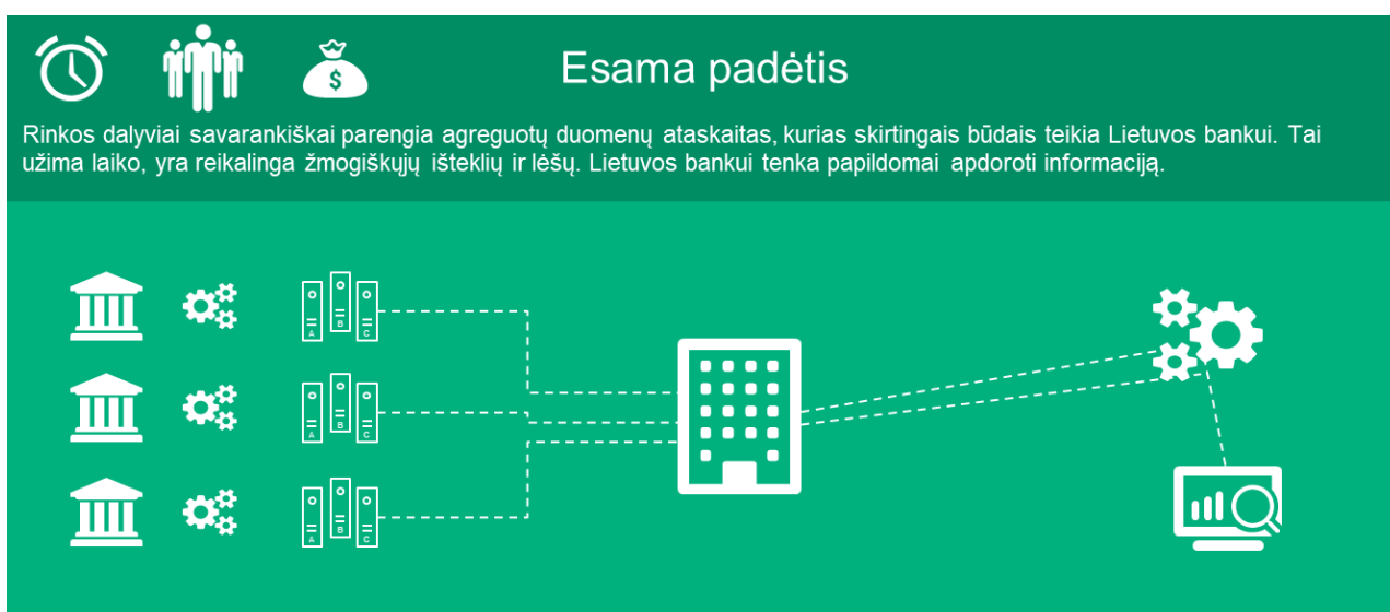
1 pav. Dabartinis duomenų teikimo Lietuvos bankui procesas

FRD tenkanti atskaitomybės našta nemaža, nevienoda našta tenka skirtingiems sektoriams. Kadangi skirtingoms funkcijoms atlikti reikalingi nevienodo pjūvio duomenys ir ES institucijų keliami reikalavimai bei papildomai nustatomi nacionaliniai reikalavimai skiriasi, Lietuvos bankui skirtingu periodiškumu pateikiama daug besiskiriančių ataskaitų formų. Šiuo metu finansų rinkos dalyviai ataskaitas Lietuvos bankui teikia įvairiu formatu, daugiausia XBRL, XML, Excel , Word ar PDF failais, siunčiamais per įvairias ataskaitų teikimo sistemas (Ataskaitų priėmimo sistemą APS, Internetinę ataskaitų priėmimo sistemą i-APS, Apsikeitimo failais sistemą AFS) ar el. paštu.